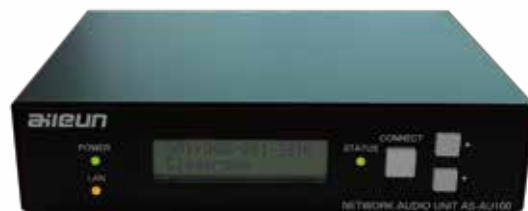
ネットワークオーディオ ユニット AS-AU100