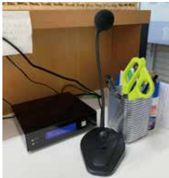
机に設置されたAS-AU100とマイク

先生方はもとより、生徒にも簡単に運用ができるよう、双方のAS-AU100を常時接続状態にし、マイクのON・OFFスイッチを切り替えるだけで通話ができるようにしました。