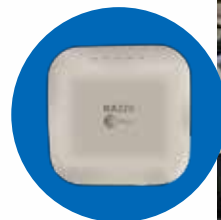
いえからオフィス

※「いえからオフィス」はインターネット環境のある拠点間にデバイスを接続するだけで簡易的にVPN接続として構築できる端末です。