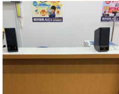
カウンターに置かれたスピーカー