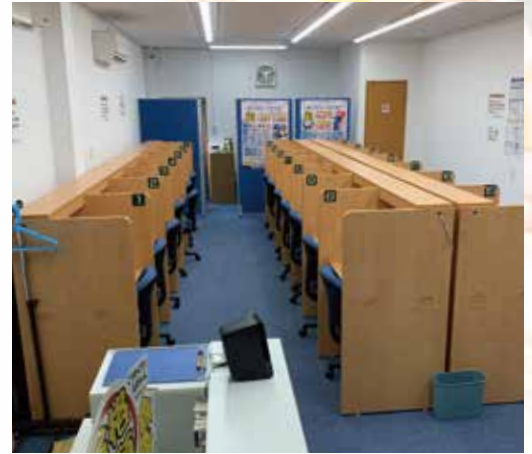
本部教室と線路を挟んだ場所にある自習室

生徒への指導や会話ができるよう、コミュニケーションツールとして音声 システムの導入を検討しましたが、本部教室と自習室が線路を跨いだ立 地にあるため、直接配線ができないという問題に直面しました。