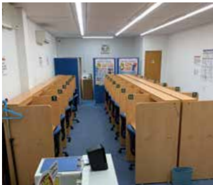
本部教室から離れた自習室

本部教室～自習室間は、AS-AU100を導入したことにより、いつでも会話ができるという安心感が生まれます。