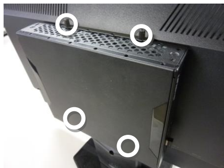
エルルーア取り付けネジ (手回しネジ)

エルルーアをモニターマウント金具にエルルーア取り付けネジ 4 本で取り付けます。(図の○の部分に取り付けます)