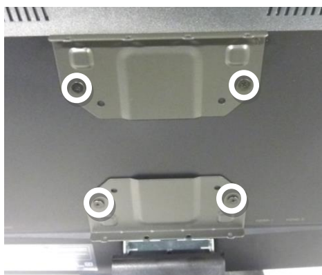
モニター取り付けネジ (M4 平頭×10mm)