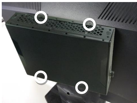
エルルーア取り付けネジ (M3 平頭×4mm)

エルルーアをモニターマウント金具にエルルーア取り付けネジ 4 本で取り付けます。(図の○の部分に取り付けます) <No.2 プラスドライバー使用>